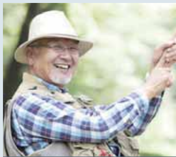
定年後の自由時間