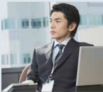
定年までの労働時間

定年退職後の方が過ごす自由時間は、約8万時間と 言われています。これは、23歳から働き始めて65歳まで の労働時間とほぼ同じです。せっかくの自由な時間、 より良い聞こえで楽しみませんか？